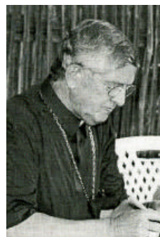
Monsignor Cesare Mazzolari - Vescovo di Rumbek Sud-Sudan

tende questo popolo, dando per scontata la firma della pace, è purtroppo un'altra emergenza umanitaria. Dei quattro milioni di sfollati interni (a Khartoum e nelle città del nord) ed esterni, in particolar modo in Uganda, si prevede il rientro di almeno un milione di persone. Questo creerà gravi problemi sia per quanto riguarda il cibo che la salute. Ora più che mai hanno bisogno di un aiuto concreto.