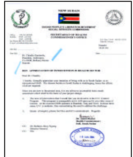
Lettera rilasciata ad Anthropos dal Ministro della Sanità Hon. Dott. Achol Marial Deng

niera impressionante. Nondimeno in Sud-Sudan non vi è manodopera specializzata e, pertanto, anche questa deve esser inviata da fuori. La mancanza di energia elettrica, la difficoltà delle comunicazioni che viene ovviata con grande difficoltà mediante ponti radio, la carenza cronica di fondi che giungono esclusivamente da donatori, pone enormi difficoltà. Nondimeno anche il personale sanitario è scarsissimo, per non dire inesistente. Il Sud-Sudan da decenni ormai non ha nemmeno scuole e, quindi, è anche impossibile reperire personale medico e paramedico sul posto. La situazione scolastica è un altro argomento scottante. E' sempre grazie al lavoro dei religiosi che sono state rimesse in funzione alcune scuole primarie le cui condizioni logistiche, però sono simili a quelle sanitarie.