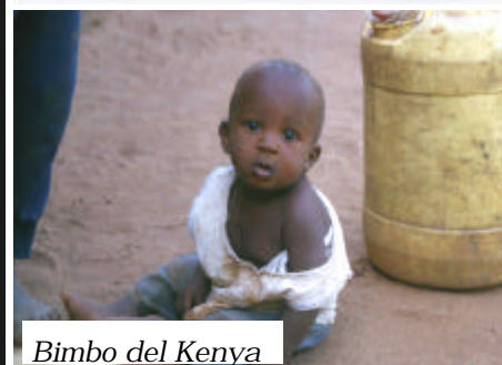
Bimbo del Kenya