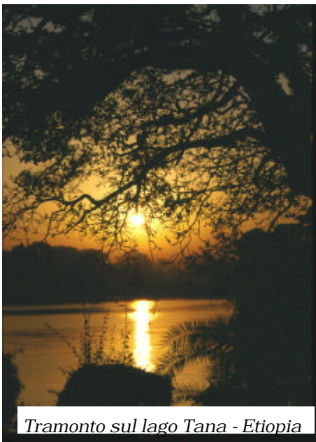
Tramonto sul lago Tana - Etiopia

FOTO 20 x 30 DA ACQUISTARE UN MODO COME UN ALTRO PER AIUTARE ANTHROPOS LE TROVERETE SUL SITO WEB www.associazioneanthropos.it